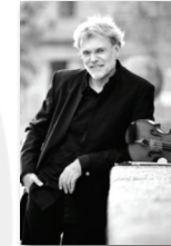
Krzysztof Wisniewski Poland, Concertmaster Orquesta Nacional de España