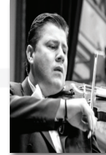
Catalin Desaga Roumania, Concertmaster Philharmonie der Nationen