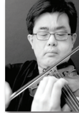
Eiichi Chijiwa Japan, Concertmaster Orchestre de Paris