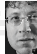
Sandro Laffranchini Italy, Principal Orchestra della Scala di Milano