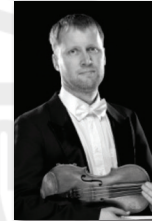
Sandis Steinbergs Latvia, Concertmaster Latvian National Symphony